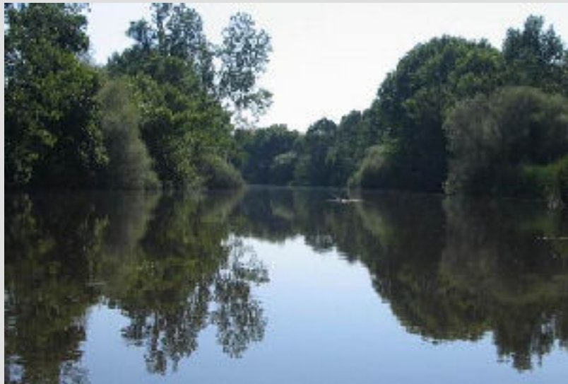
Ríu Jerti a su pasu pol Aldehuela

En muchos de los regatos d'Estremaúra poemus vel -si andamus con un poquinu de cuidiáu- un pajarinu azul con el pechu colol naranja. Los labraoris, pastoris y pescaoris lo conocin bien, anqui es difícil velu de cerca. Lo más siguru es que lo veamus volandu pol cima l'arroyu, porque no deja que se le arrimin las presonas.