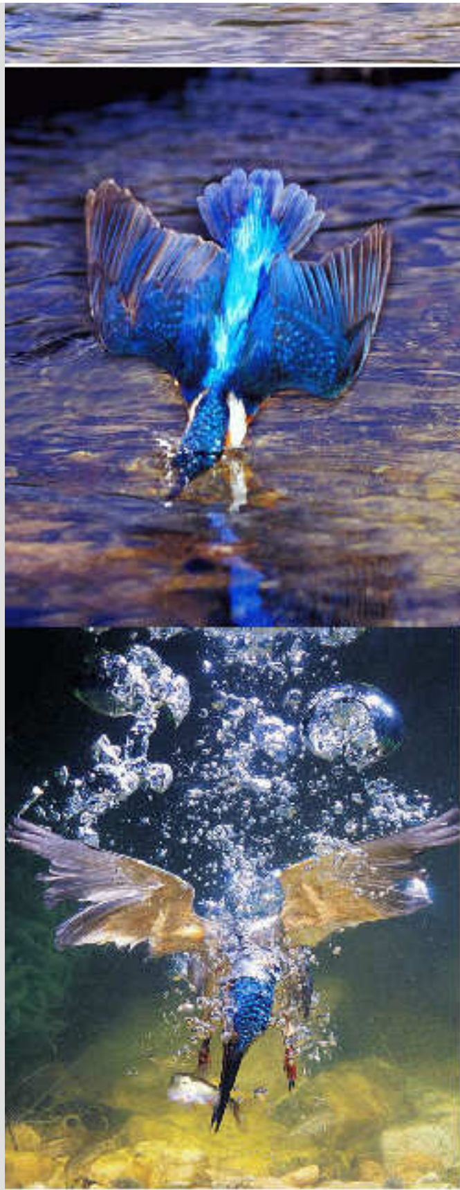
Picapecí en acción

El casu es que en muchus pueblus d'Estremaúra el nombri populal de l' Alcedo atthis tiei que vel cona su costumbrí de pescal lospecinus; asina, se lo conoci