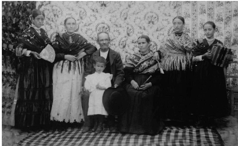
Esta imagen de un niño, sus bisabuelos y varias tías fue tomada en el ya desaparecido pueblo extremeño de Talavera la Real ¿Cuántos descendientes reconocerán en ella a sus antepasados sin siquiera conocerse entre ellos?

Los primeros pasos para conocer a nuestros antepasados más cercanos y localizar parientes actuales están al alcance de cualquier persona que, sin conocimientos previos de genealogía, puede comenzar mediante las sugerencias que aquí expondremos.