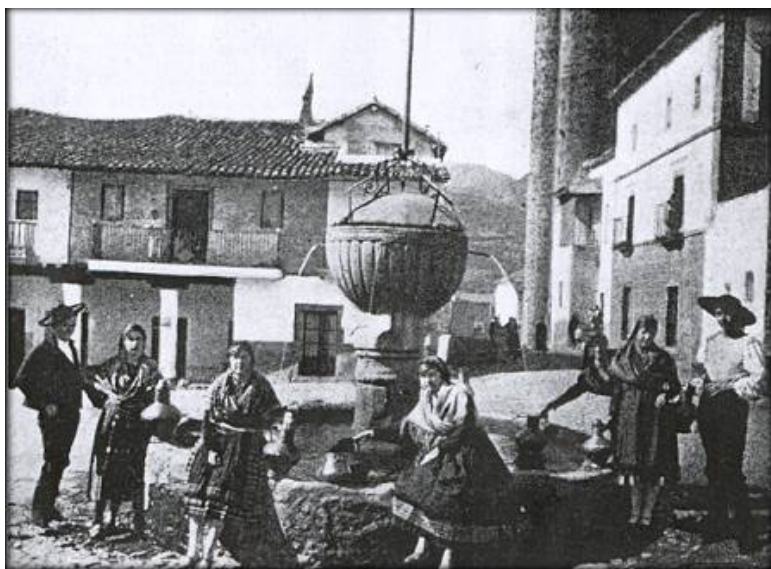
Quizás esta fuente, que nos sitúa en Guadalupe, sea el primer indicio para descifrar los personajes de la foto, es posible que otros familiares desconocidos por nosotros conserven imágenes parecidas con los nombres detallados.

Aunque el receptor no sepa nada de nuestra familia, lo que le pediremos es que intente hacer llegar el mensaje a vecinos del pueblo que pudieran saber algo de nuestros parientes. Quizás en cuestión de horas recibamos un mensaje de alguien que tenga relación familiar o conozca a personas de nuestro apellido.